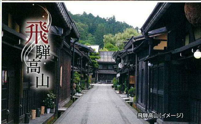
飛騨高山(イメージ)