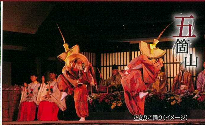
こきりこ踊り(イメージ)